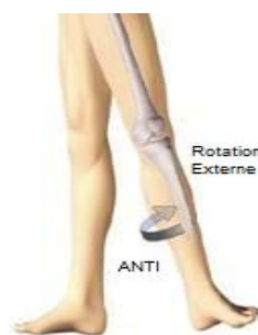
Strapping anti rotation externe