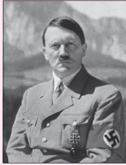
Extrait de J. Portes, Initiation à l'histoire du monde au XX e siècle , Ellipses, 1999.

Hitler est persuadé depuis longtemps de la faiblesse des pays démocratiques. Son but est d'annuler certaines des clauses humiliantes du traité de Versailles, puis de mettre en pratique sa recherche d'espace pour une Allemagne surpeuplée, aux dépens des peuples inférieurs que sont les Slaves et de l'ennemi traditionnel, les Français.