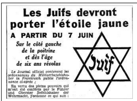
Source : http://etoilejaune-anniversaire.blogspot.fr/2016/05/29-mai-1942-mais-que-sest-il-donc-passe.html Le journal "Le Matin" du 1er juin 1942

Que doivent-ils faire ? Qu'est-ce qui leur est interdit ?