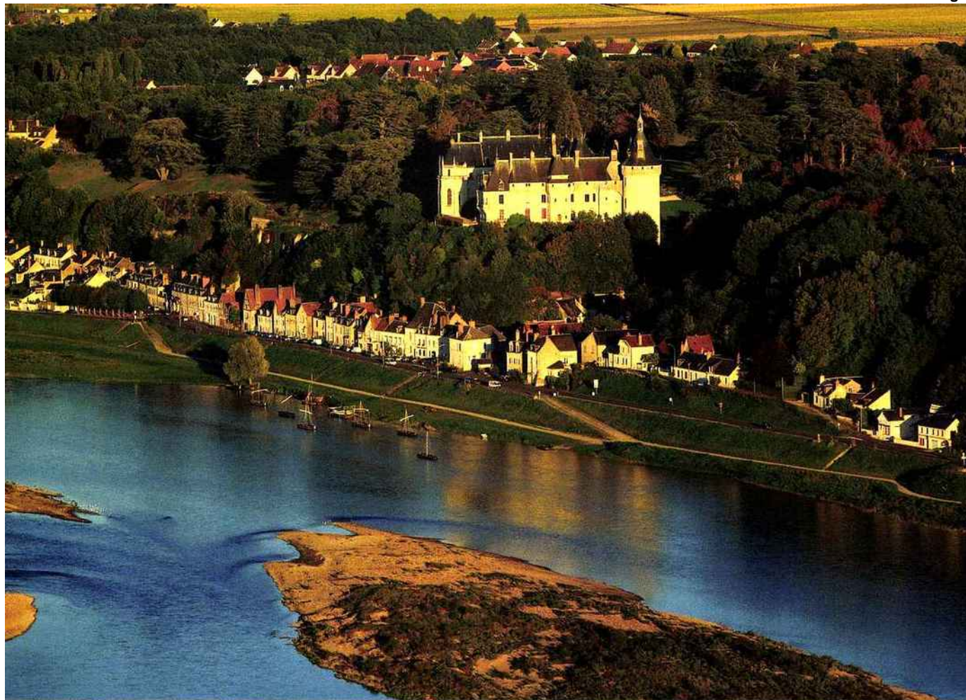
Chaumont-sur-Loire, avec son château du XV e siècle qui domine le fleuve, est classé au patrimoine mondial de l'Unesco.