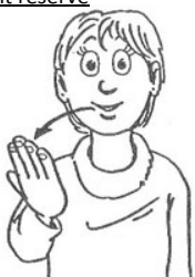
Langage des signes