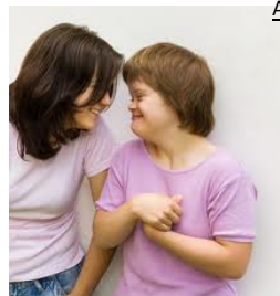
Aide auprès des handicapés mentaux