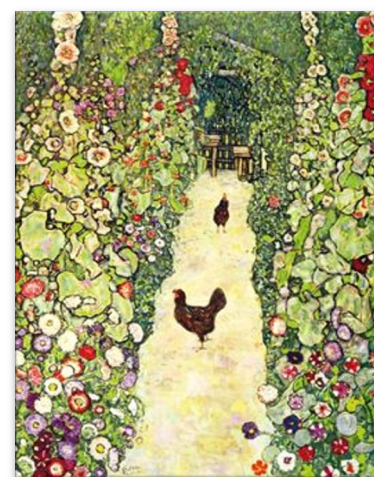
Jardin avec des coqs (1917), huile sur toile

C'est l'œuvre la plus célèbre de Klimt. Elle représente un couple qui s'embrasse, enlacé.