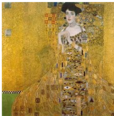
Portrait d'Adèle Bloch-Bauer I , huile sur toile, feuille d'or et d'argent, 1907.

Encore aujourd'hui, ses tableaux sont reconnus dans le monde entier : « Le portrait d'Adèle Bloch-Bauer » a par exemple été vendu pour 135 millions de dollars en juin 2006 !