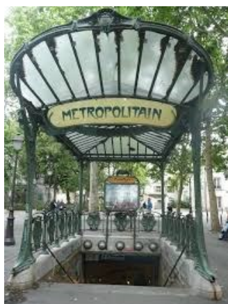
Station de métro réalisée d'après les dessins de Hector Guimard fin XIXème. Symbole de l'Art Nouveau

Il appartient au courant du Symbolisme . Ce courant est un groupe de peintres qui intègrent tout un ensemble de symboles mystérieux dans leurs tableaux. Ils ne peignent donc pas exactement ce qu'ils voient ; ils peignent une partie du monde réel auquel ils ajoutent un monde imaginaire.