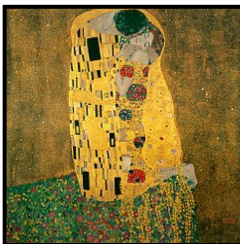
Le Baiser , huile sur toile recouverte de feuille d'or, 1907.

C'est l'œuvre la plus célèbre de Klimt. Elle représente un couple qui s'embrasse, enlacé.