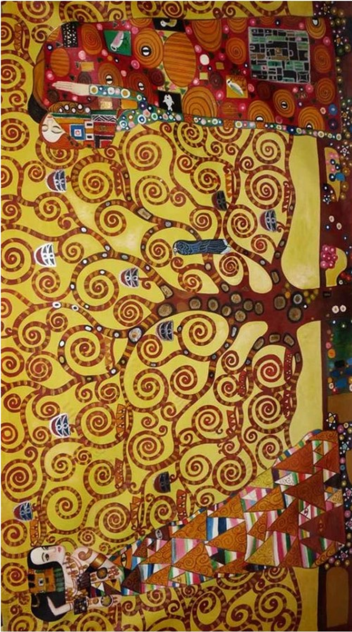
L'Arbre de Vie, Gustav KLIMT