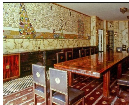
Réalisation de la décoration du Palais Stoclet, à partir du travail préparatoire de Klimt

Tout décorateur qu'il est, Klimt utilise des matériaux nobles et vivement colorés, comme l'or, dans cette œuvre comme dans d'autres, dont « Le portrait d'Adèle Bloch-Bauer ».