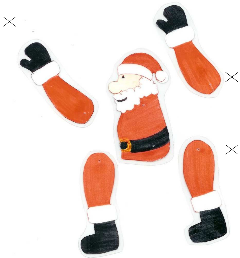
Schéma de montage des 3 ficelles pour le Père Noël acrobate. → Dessine les 2 ficelles qui maintiennent le pantin et la ficelle qui servira à attacher le pantin à l'armature en bois.