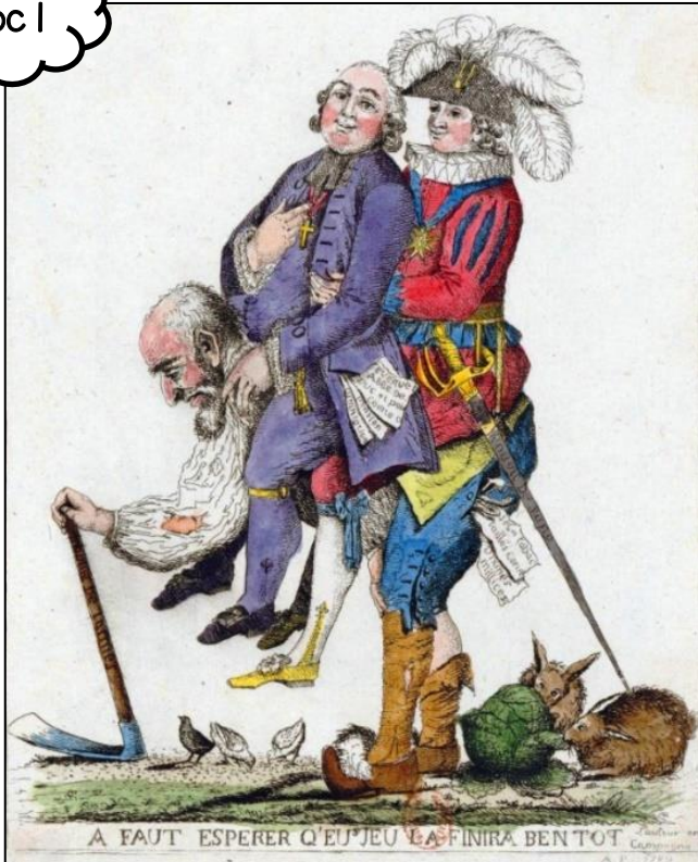
Gravure coloriée anonyme, mai 1789 (Bibliothèque nationale de France, Paris).