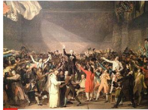
Peinture de Jacques-Louis David, XVIIIe siècle (musée Carnavalet, Paris).