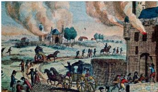
Gravure anonyme, XVIIIe siècle (musée Carnavalet, Paris).