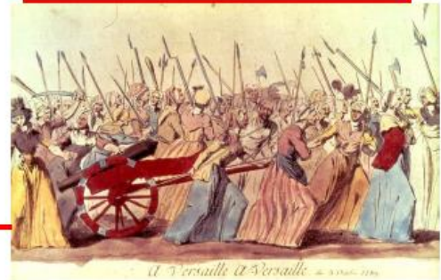
Gravure anonyme, XVIIIe siècle (musée Carnavalet, Paris).

Vote de la Déclaration des droits de l'homme et du citoyen