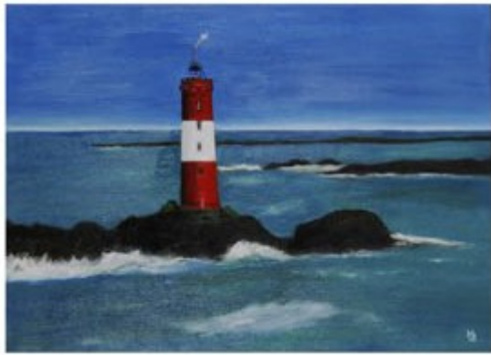
LES GRANDS CARDINAUX (Bretagne)