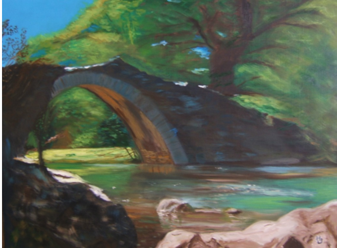
VIEUX PONT GENOIS