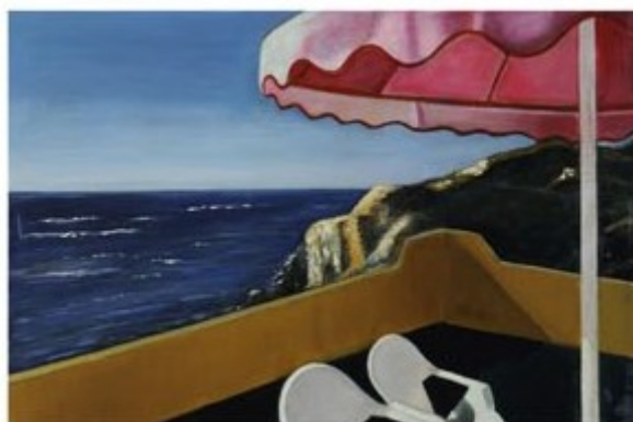
LE PARASOL ROSE