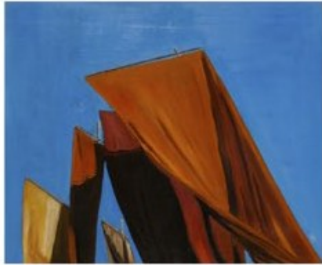
TOUTES VOILES DEHORS