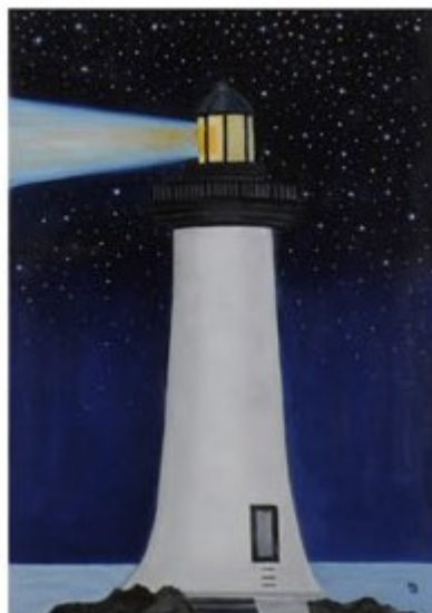
LA NUIT DU PHARE