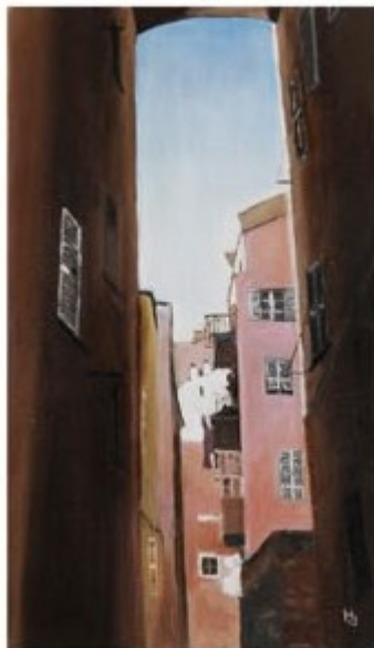
RUELLE DE BASTIA