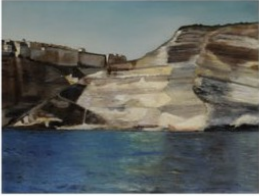
LES FALAISES DE BONIFACIO