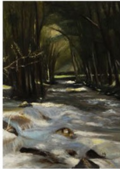
TORRENT A TRUITES