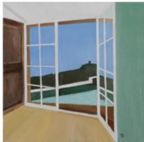
LA FENETRE OUVERTE