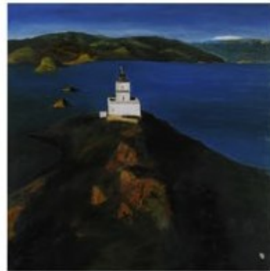
LE PHARE DES SANGUINAIRES