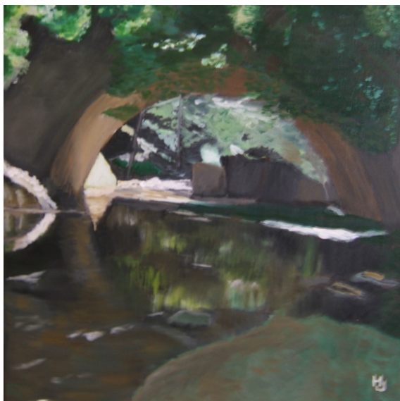
LE PONT DE L'ENFER