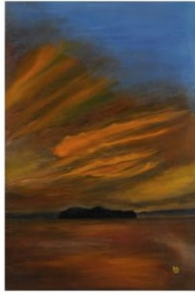
ILE DE LERNE AU COUCHANT (Bretagne)