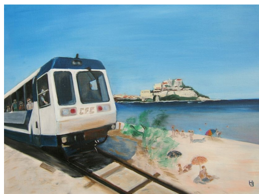
LE PETIT TRAIN DU LITTORAL