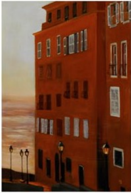
COUCHER DE SOLEIL A BASTIA