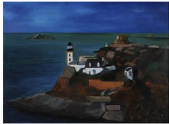
ILE DE LOUET (Bretagne)