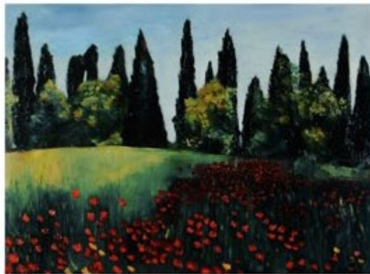
CYPRES AUX FLEURS ROUGES