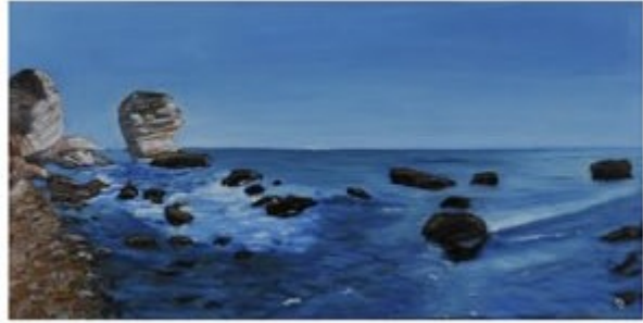
LE GRAIN DE SABLE