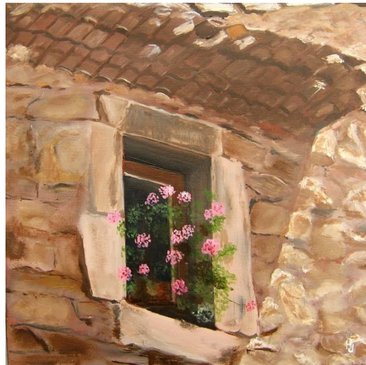
LES VIEILLES PIERRES