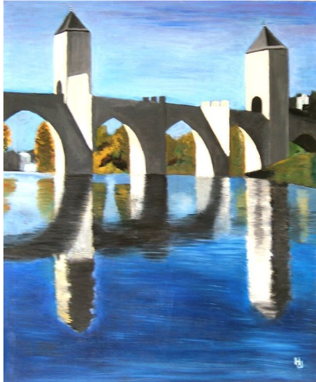
LE PONT D'ALBI