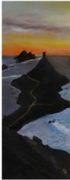
LES ILES SANGUINAIRES