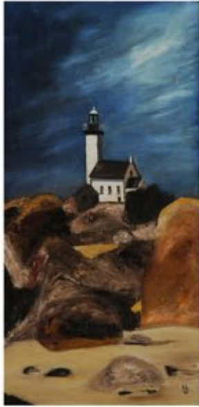
PHARE DE PONTUSVAL (Bretagne)