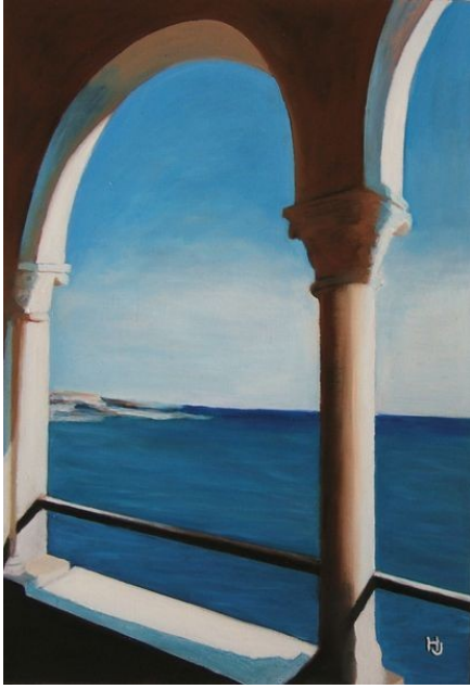
TERRASSE SUR LA MER