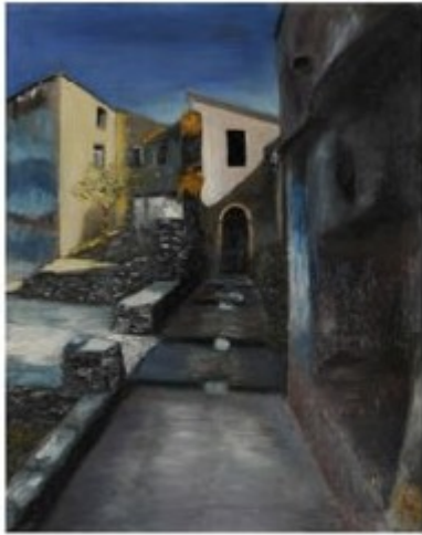
RUELLE AU CAP CORSE