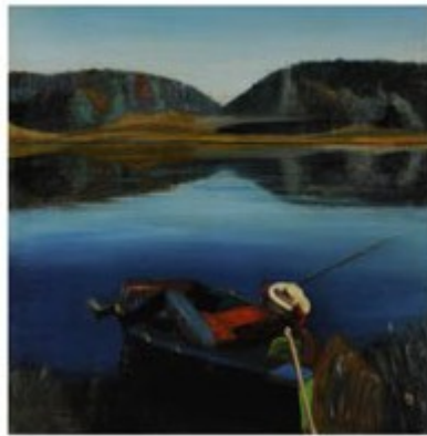
LA SIESTE DU PECHEUR