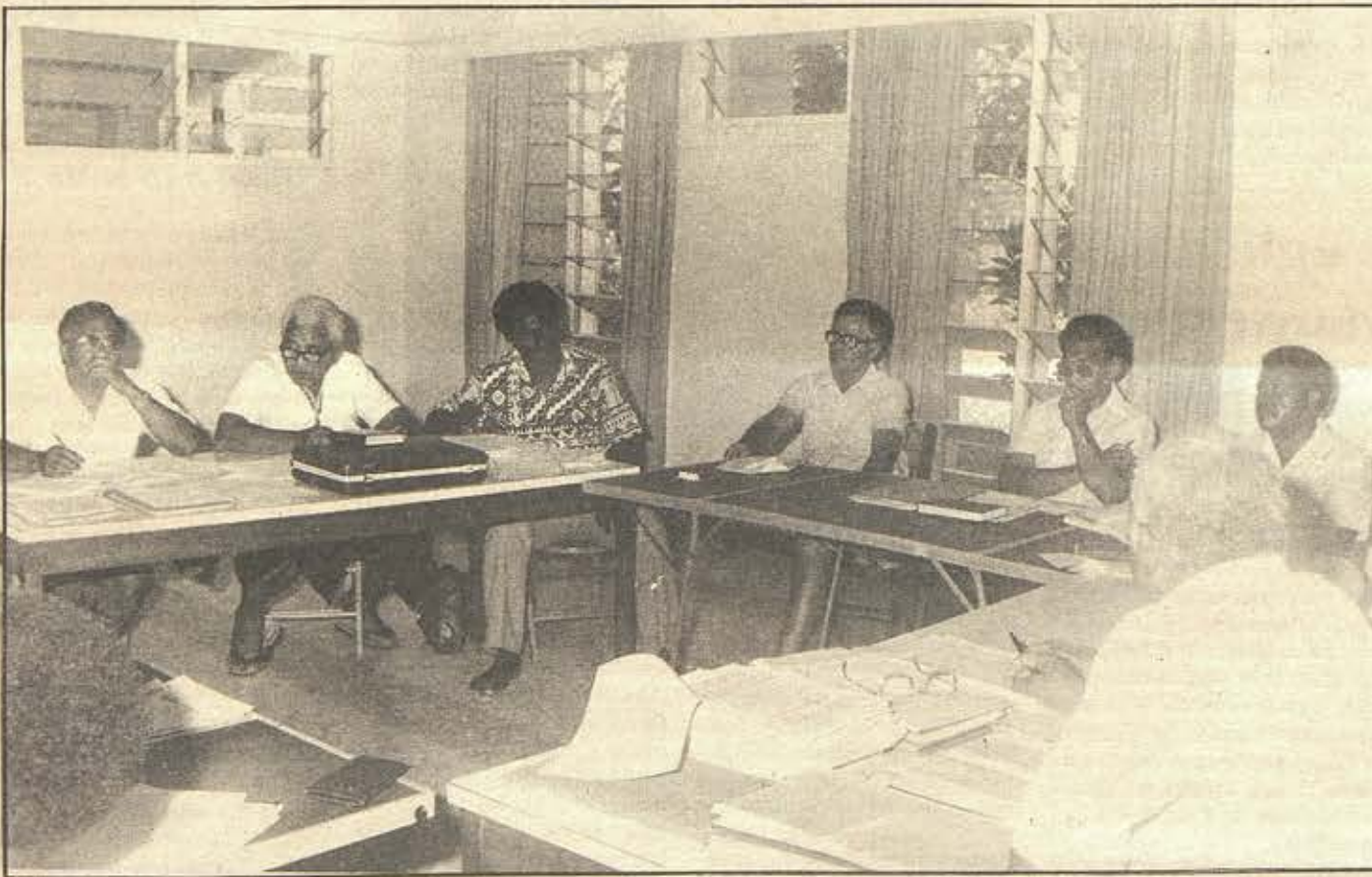
Réunion de l'Association des Ecoles de théologie du pacifique.