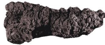
CROTTE DE TYREX

Des griffes fortes, pointues et tranchantes.