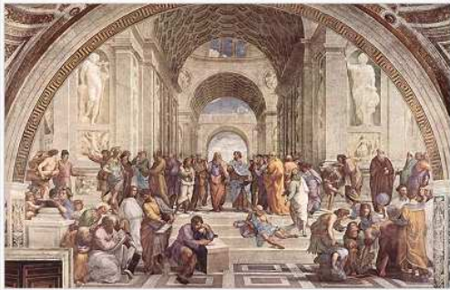
L'École d'Athènes, de Raphaël