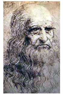
François 1er Rabelais Léonard de Vinci