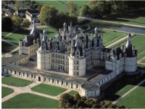
Château de Chambord