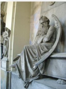
Dans la mythologie grecque, Chronos est le dieu du temps