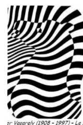
or Vasarely (1908 - 1997) - Le zè