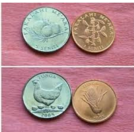
Leur monnaie est le Pa'Anga.