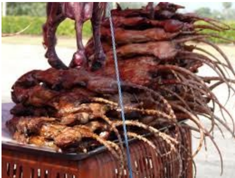
Voici leur spécialité culinaire, un rat rôti.

Leur devise est Dieu et Tonga sont héritages.