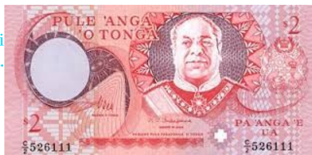
Et voici un billet.