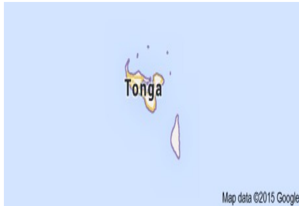
Pays du Tonga