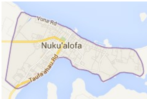
Capitale du Tonga