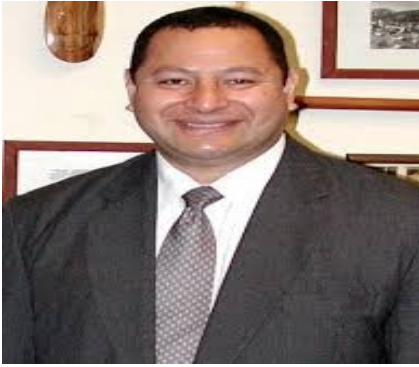
Tupou VI roi depuis 2012.

Son couronnement date du 4 juillet 2015 . Son monarque est George Tupou V et son premier ministre Lord Tu'ivakano 'Akilisi Pohiva . Les habitant s'appellent les Tongiens .