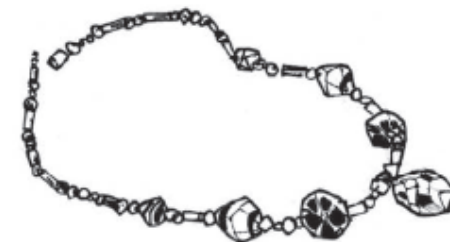
Collier : ..... €