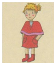
Le Petit Chaperon rouge

La boîte à outils dans - avec - son - l' - près - les - je - sous - pour - où