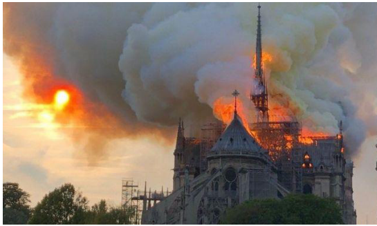
L'incendie du 15 avril 2019

La cathédrale Notre-Dame a été construite sur l'île de la Cité, une île sur la Seine où se trouve le plus vieux quartier de Paris. C'est le berceau de la capitale. Construite au Moyen Âge, entre 1163 et 1345, Notre-Dame de Paris est une merveille de construction gothique aux dimensions impressionnantes.