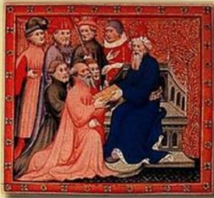
À la Cour du Grand Khan