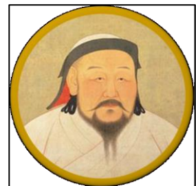
L'extraordinaire voyage de Marco Polo, Astrapi

Les Yuans régneront encore longtemps puis une autre dynastie les remplaça.