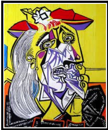
La femme qui pleure, Picasso, 1937