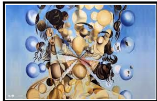
Galatea des espheres, Dali, 1952

→ Y'a-t-il des points communs à ces 3 oeuvres ? Pourquoi les artistes ont-ils choisi des formes géométriques ? Quel sentiment se dégage de chacun de ses portraits ?