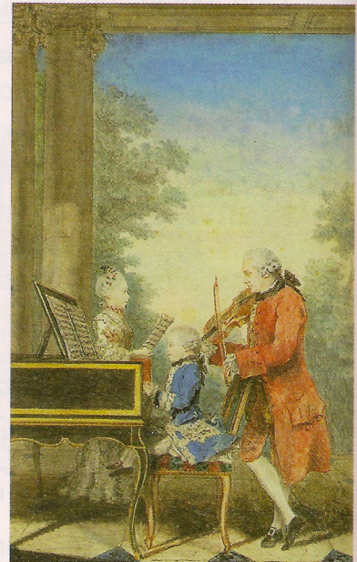
Mozart enfant, avec son père et sa sœur.

Il était même capable d'improviser, c'est-à-dire d'inventer une musique au fur et à mesure qu'il la jouait.