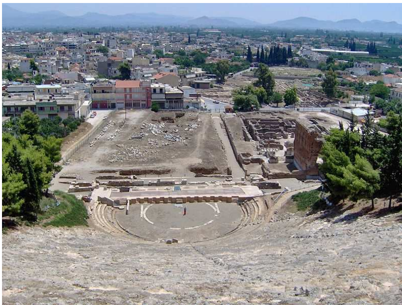
Ville moderne d'Argos et les ruines du théâtre antique