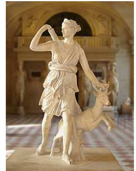
Ἡ δέεση Ἀρτέμις

Eurysthée : fils de Nicippé, roi de l'Argolide, il est l'ennemi le plus implacable d'Héraclès, qui est son esclave pendant ses douze travaux.