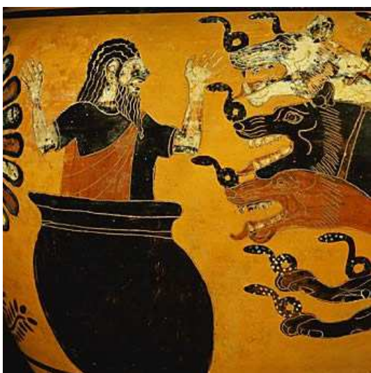
Ευρυσθέε dans son chaudron