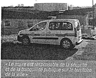
« Le maire est responsable de la sécurité et de la tranquillité publique sur le territoire de la ville »

Notre objectif est de faire baisser de moitié tous les chiffres catastrophiques que nous avons connus ces dernières années.