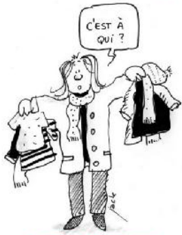
ramasseur de vêtements après la récré