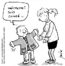
réparatrice de fermeture Eclair