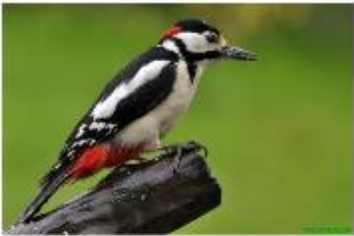
Un pic épeiche