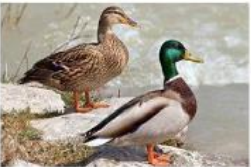
Canards colvert : la femelle et le mâle