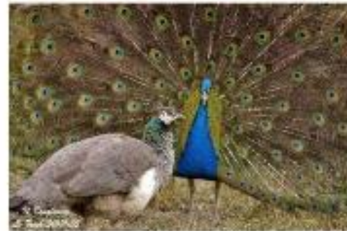
Paons : la femelle (grise) et le mâle (multicolore)