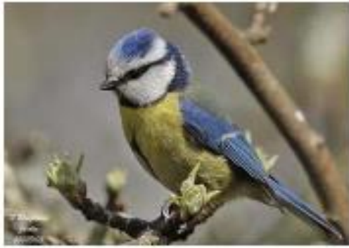
Une mésange bleue