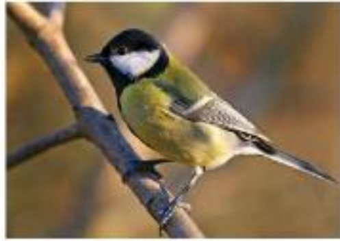
Une mésange charbonnière