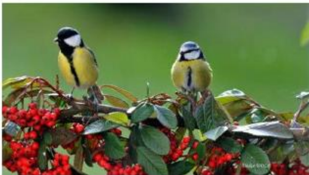
Mésange charbonnière et mésange bleue