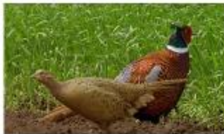
Un couple de faisans : la femelle au premier plan, le mâle à l'arrière-plan