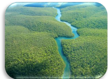
La forêt amazonienne