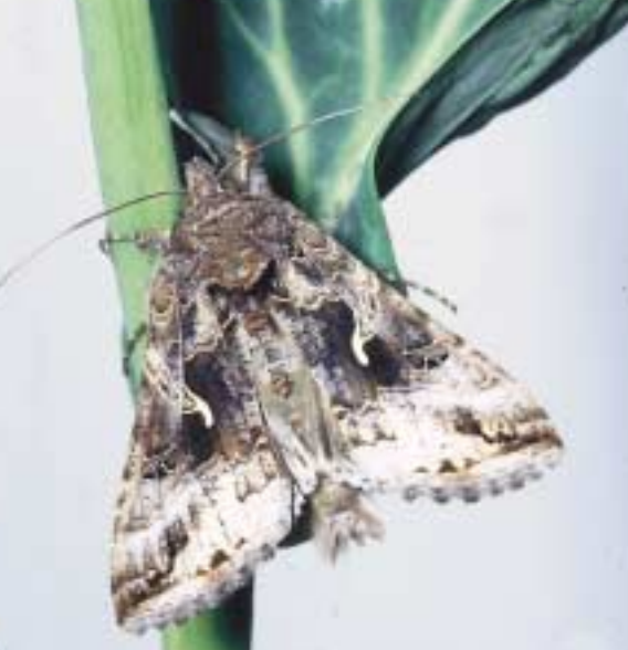
Le Gamma est un vrai migrateur qui arrive tous les ans en Europe en grand nombre. Cette Noctuelle peut être observée de jour, au crépuscule et de nuit.