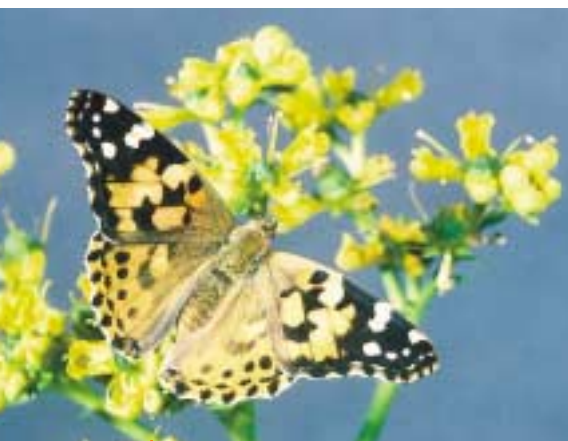
La Belle Dame est un vrai migrateur originaire d'Afrique du Nord. Sa migration annuelle en Europe est plus ou moins massive selon les années. La dernière grande invasion en France remonte à 1996.

jusqu'aux îles Shetland ou en Islande, soit ils longent la côte méditerranéenne, empruntent la vallée du Rhône puis celle de la Saône, jusqu'aux Pays-Bas. Dans les deux cas, les papillons arrivés dans le Sud de l'Angleterre ou en Belgique peuvent poursuivre vers les côtes danoises puis la Scandinavie, notamment la Norvège, et atteindre le cercle polaire arctique.