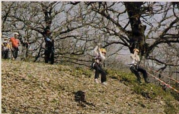
En avant pour la tyrolienne avec atterrissage sur le stade de Roquefort.