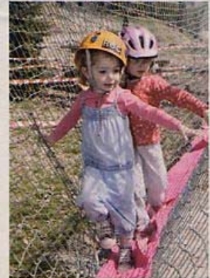
Activités ludiques dès deux ans... ici dans le filet suspendu.