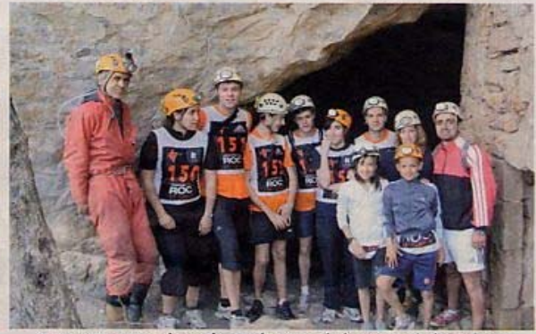
Une petite pose photo devant l'entrée de la grotte de la Cabane à Saint-Paul-des-Fonts.