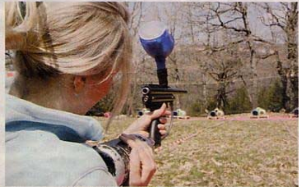
Plus de 600 participants sur deux jours ! Roc et canyon et l'office de tourisme de Roquefort ont fait un carton plein avec cette 2e édition des Roq'Rando Raid.