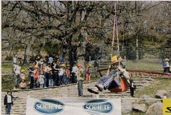
Une tyrolienne adaptée au plus petit, histoire de découvrir les premières sensations fortes.