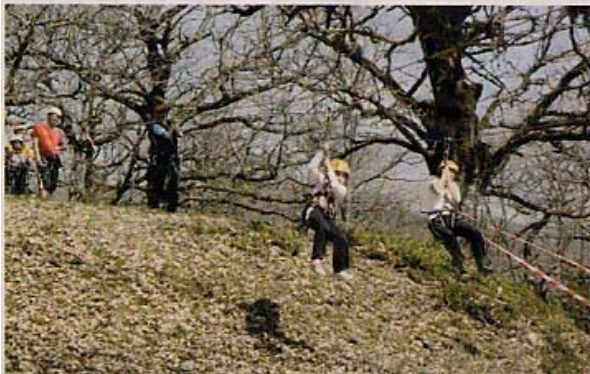
En avant pour la tyrolienne avec atterrissage sur le stade de Roquefort.