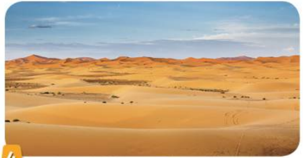
4 Le désert du Sahara en Algérie (Afrique).