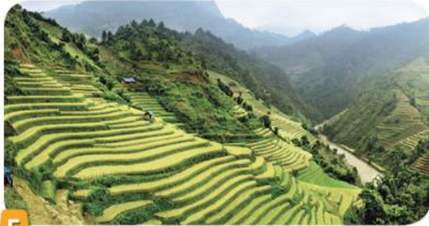
5 Les rizières au Vietnam (Asie).