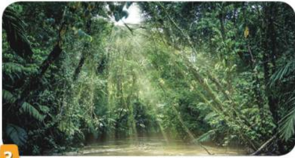
3 La forêt amazonienne au Brésil (Amérique du Sud).