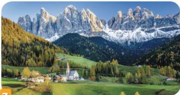
7 Les montagnes du Tyrol en Autriche (Europe).