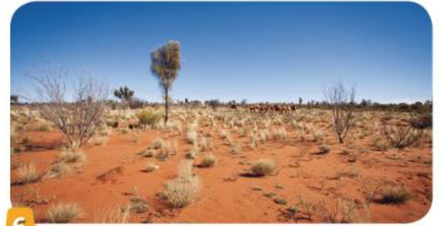
6 L'outback (arrière-pays) australien (Océanie).