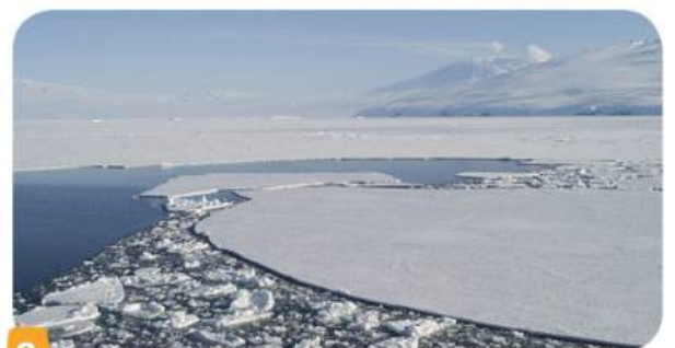
8 La terre de Victoria (Antarctique).