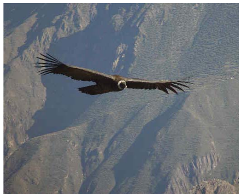
Le condor des Andes : l'oiseau volant le plus grand du monde.