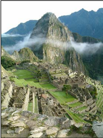
Le Machu Pichu