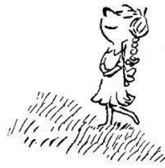
Marie-Edwige C'est ma voisine, la fille des Courteplaque. On va se marier ensemble quand on sera grand.