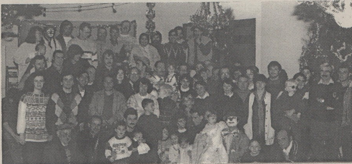
La communauté de Poitiers, au pied du sapin, à la veillée de Noël