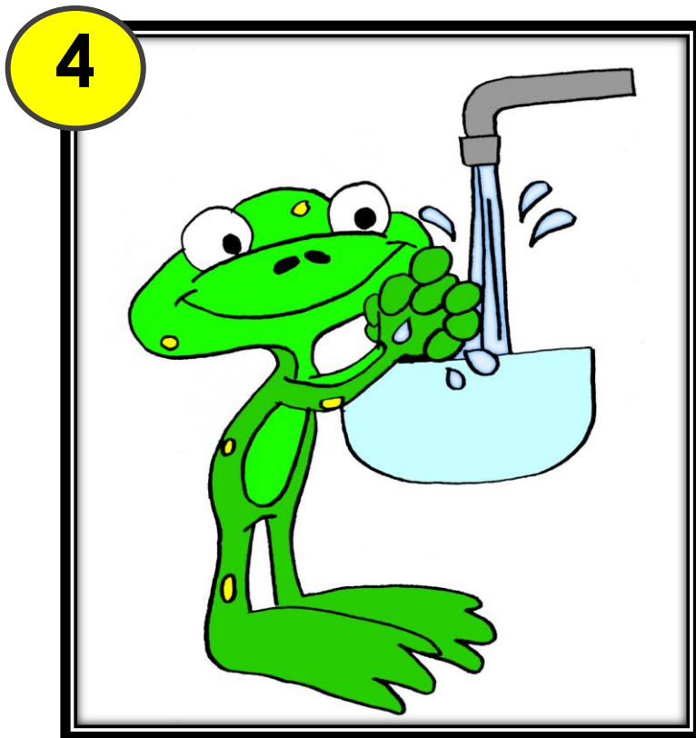
Je me lave les mains.