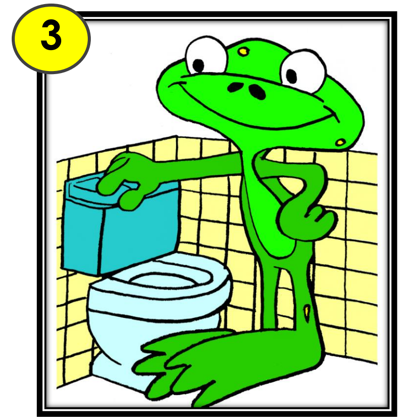
Je tire la chasse d'eau. Je vérifie que les toilettes sont propres.