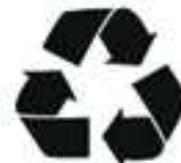
% de matière recyclée utilisée