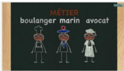
Les termes génériques