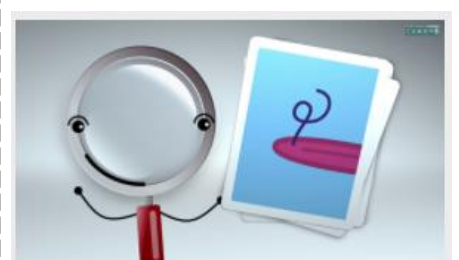
Le sens propre et le sens figuré