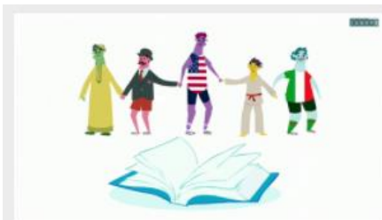
Les mots d'origine étrangère