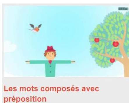
Les mots composés avec préposition