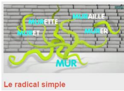
Le radical simple