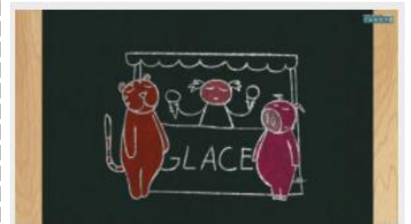
Les registres de langue