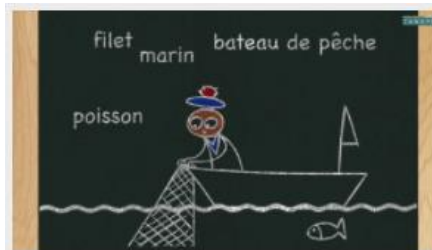
Le champ lexical