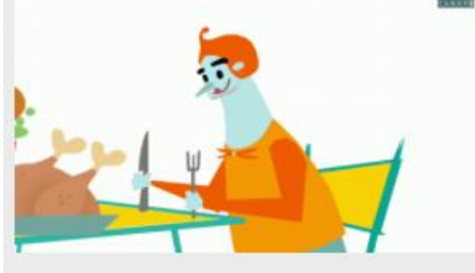
L'étude de l'origine des mots