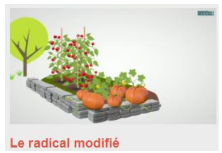
Le radical modifié