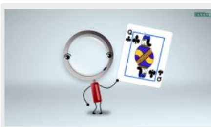
La polysémie des mots