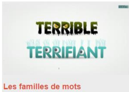
Les familles de mots