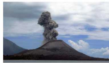
Éruption explosive ( volcans gris )