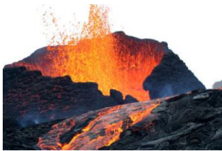
Éruption effusive ( volcans rouges )

Les volcans explosifs constituent un danger majeur à cause des fumées et des gaz qui peuvent asphyxier les êtres vivants.