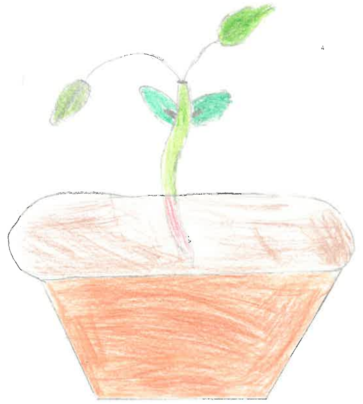
Dessin d'un plant de haricot.