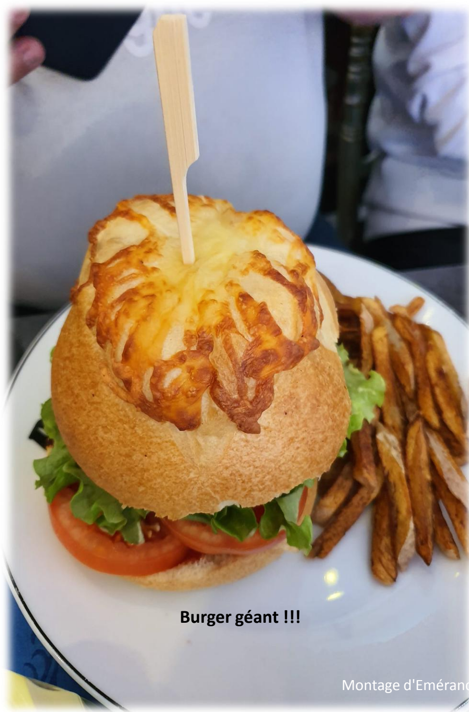
Burger géant !!!