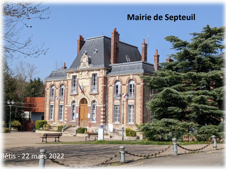
Mairie de Septeuil