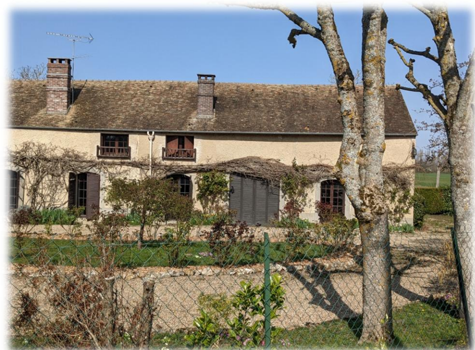
En quittant le château de Corbeville