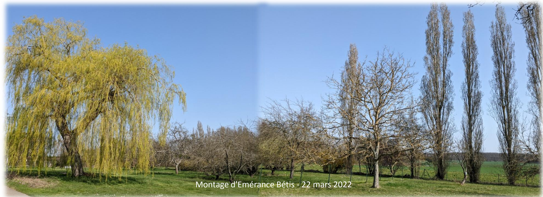
Montage d'Émérance Bétis - 22 mars 2022