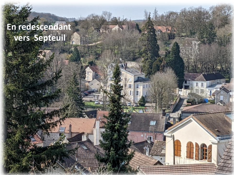
En redescendant vers Septeuil