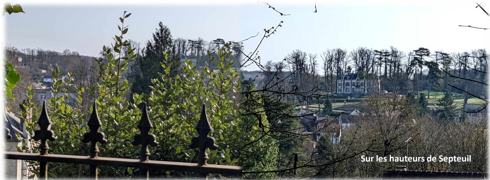
Sur les hauteurs de Septeuil