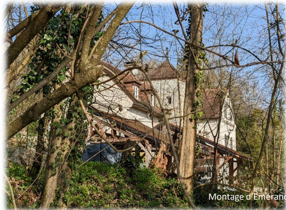
Montage d'Emeraude Bétis - 22 mars 2022