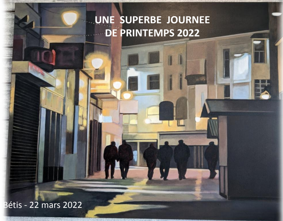
UNE SUPERBE JOURNEE DE PRINTEMPS 2022