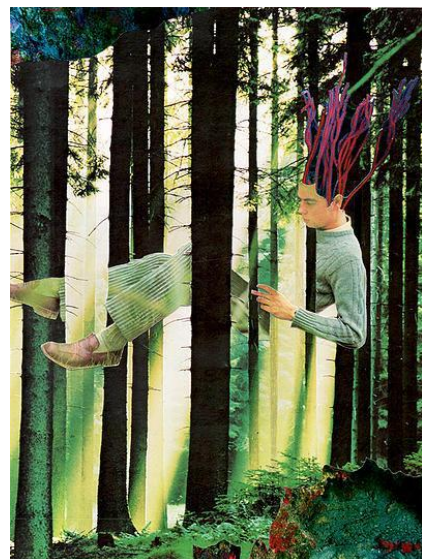
Reading himself like a wood - Schrieck