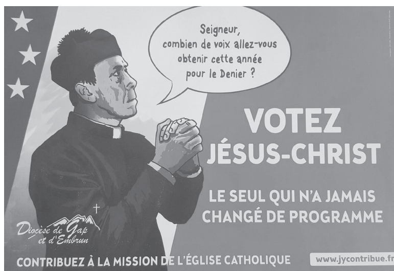
Quand l'Eglise escompte récupérer de l'argent grâce au parti clérical

C'est pourquoi nous sommes opposés à toute forme de répression civile et pénale de ce que l'on appelle « le délit de blasphème ». Le droit à la libre critique est un droit démocratique fondamental. Son corollaire obligé est la liberté d'expression la plus totale. Seuls sont visés, alors, les opinions et les faits, jamais les individus en tant que tels.