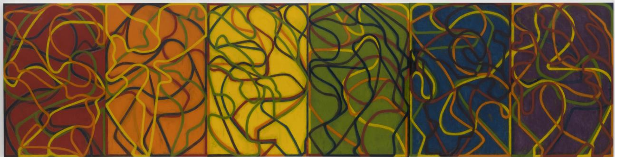
Le jardin propice de l'image plane, troisième version 2000-2006