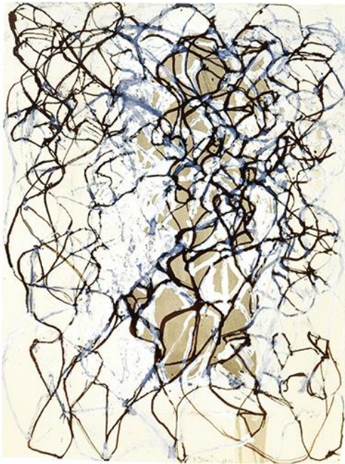
Dessin pour les Conjonctions III 1996