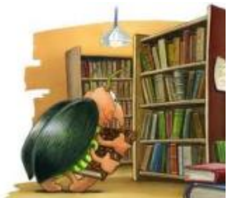
Ranger les livres.