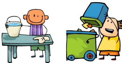
Ramasser les papiers, nettoyer les tables...