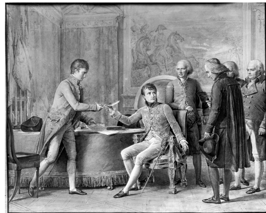
Bonaparte, s'apprêtant à signer le concordat