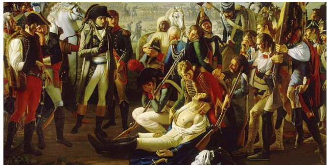
Mort du général Desaix