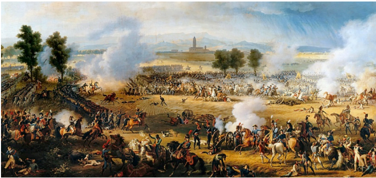
Le champ de bataille de Marengo.

Le 14 juin, il se retrouve avec son armée face aux autrichiens à Marengo .