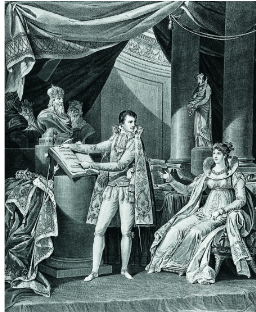
Bonaparte, lisant un extrait du code civil à son épouse, Joséphine.