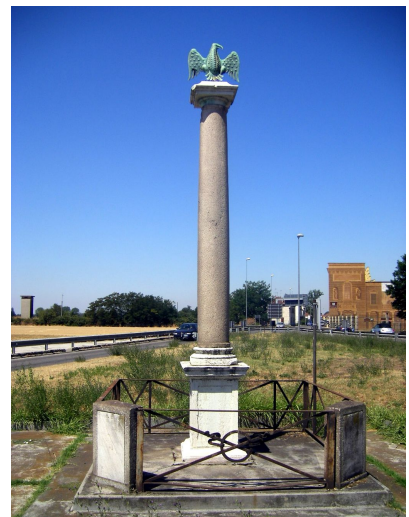
Une colonne commémorative * est encore visible à Marengo où eut lieu la bataille

L'Autriche signe la paix avec la France en 1800. L'Angleterre fera de même environ un an après.