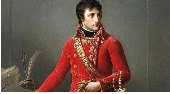
Bonaparte est nommé consul à vie

Une nouvelle constitution est rédigée dans laquelle Bonaparte a les pleins pouvoirs .