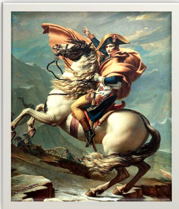
Bonaparte franchissant le col du Grand Saint-Bernard (peinture de Jacques-Louis David / 1801)