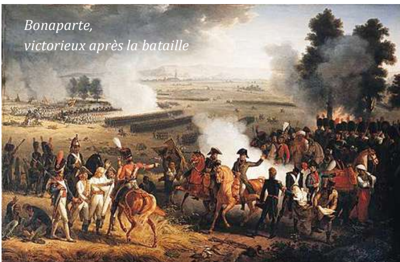
Bonaparte, victorieux après la bataille