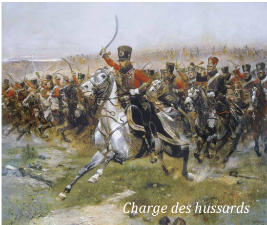
Charge des hussards

Bonaparte remporte une grande victoire mais l'un de ses meilleurs officiers y trouve la mort.