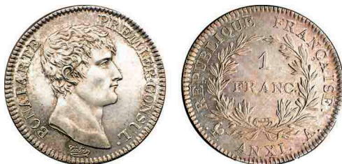
Le franc germinal s'appelle ainsi car il a été créé le 7 germinal du calendrier révolutionnaire.