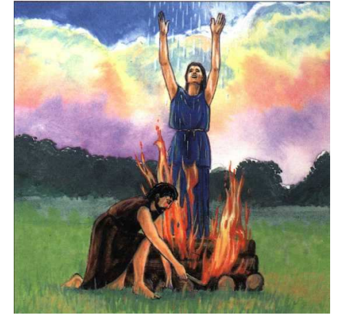
Alcmène sauvée du bûcher par Zeus