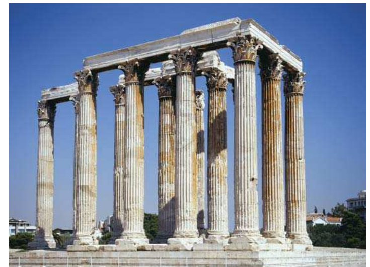
Temple de Zeus à Athènes