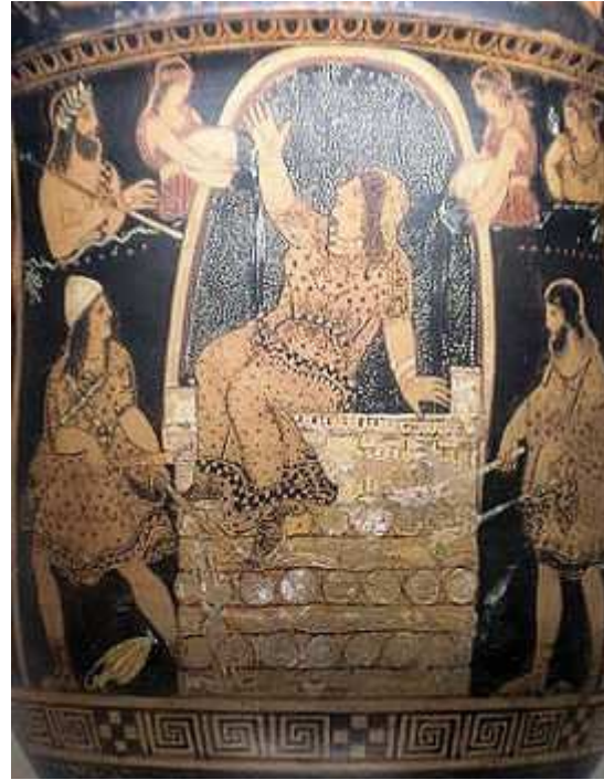
Alcmène sur le bûcher (détail d'une poterie)