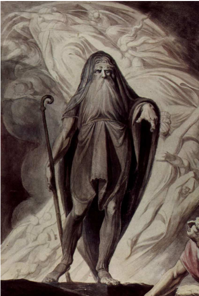
Tirésias apparaissant à Ulysse pendant le sacrifice (Füssli)

Zeus : Dieu du ciel, père des dieux et de tous les hommes. Il aime prendre toutes sortes de formes pour séduire les femmes. Il est symbolisé par l'éclair et l'aigle. Sa femme est Héra. Dans la mythologie romaine, Zeus est appelé Jupiter.