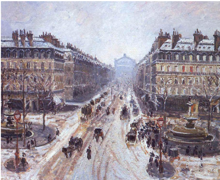
C. Pissarro " Avenue de l'Opéra - Effet de Neige "1898