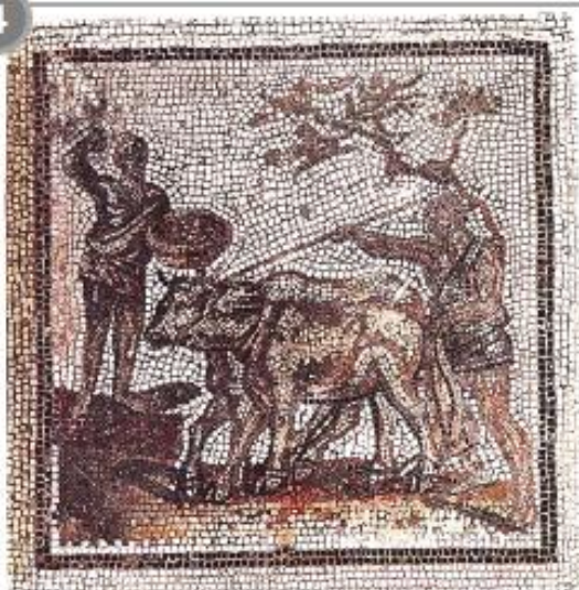
Mosaïque de Saint-Romain-en-Gal, III ème siècle ap. J.-C.