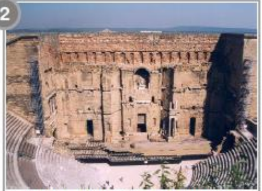
Théâtre antique d'Orange (Vaucluse)