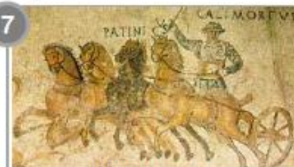
Course de chars (détail de mosaïque)