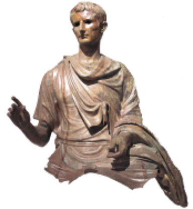
Statue équestre d'Auguste (fragment)