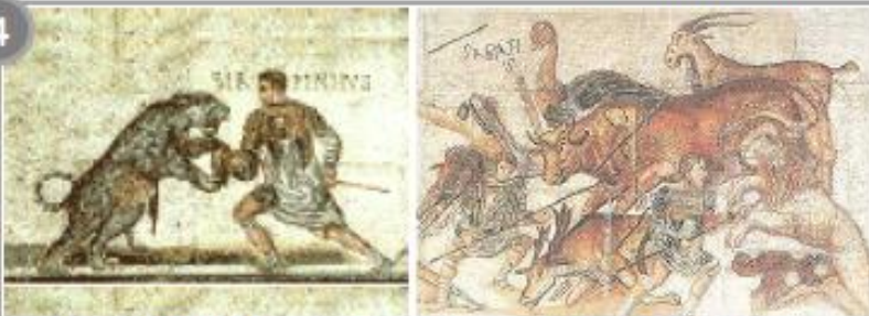
Les jeux pratiqués dans les arènes : animaux et gladiateurs (détails de mosaïques)