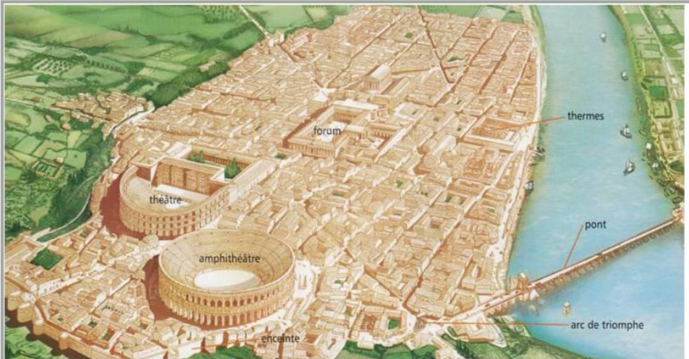
Plan d'Arles, II e siècle ap. J.-C. (reconstitution)