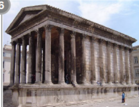
Maison carrée, Nîmes Temple dédié aux petits-fils d'Auguste