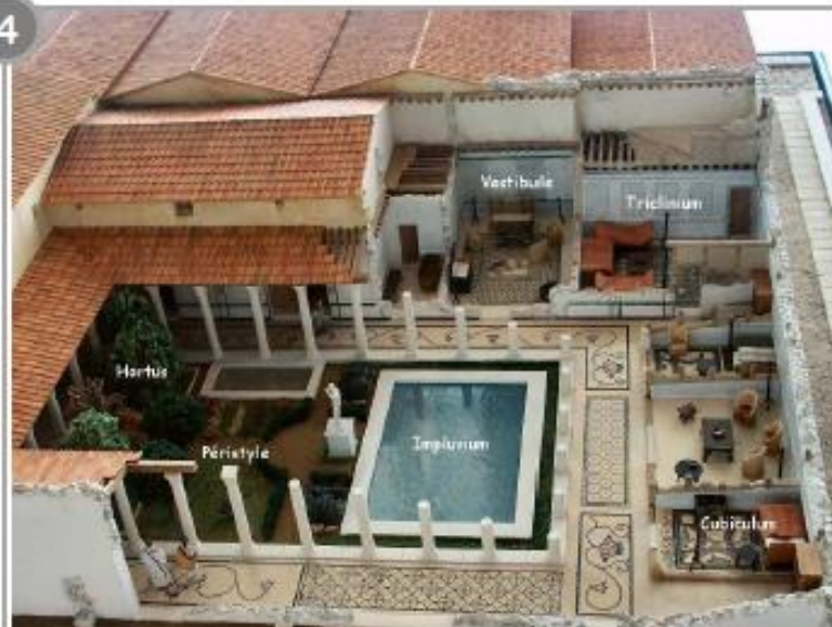
Maquette d'une domus, réalisée par Patrice Berger