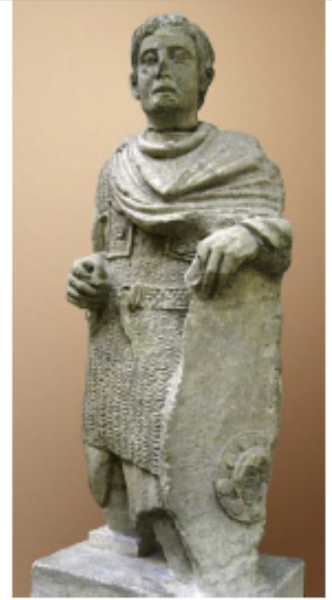
Statue d'un Gallo-Romain, découverte à Vachères, Ier siècle ap. J.-C.