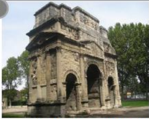
Arc de triomphe d'Orange (Vaucluse)