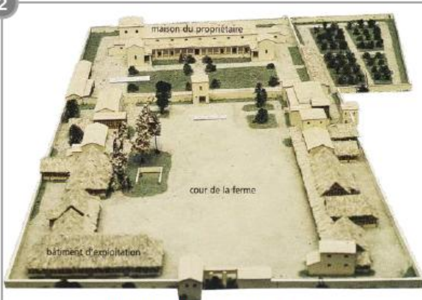
Maquette d'une villa gallo-romaine