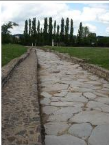
Voie romaine à Saint-Romain-en-Gal