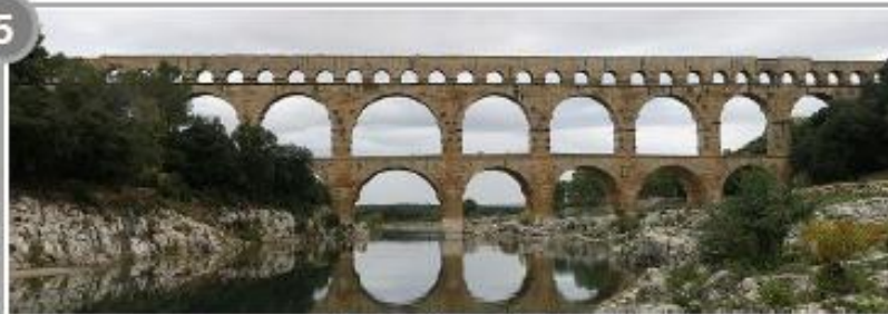
Le pont du Gard, I er siècle ap. J.-C.