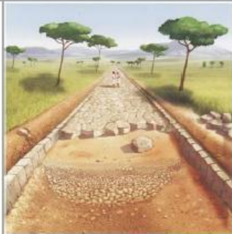
Coupe d'une voie romaine