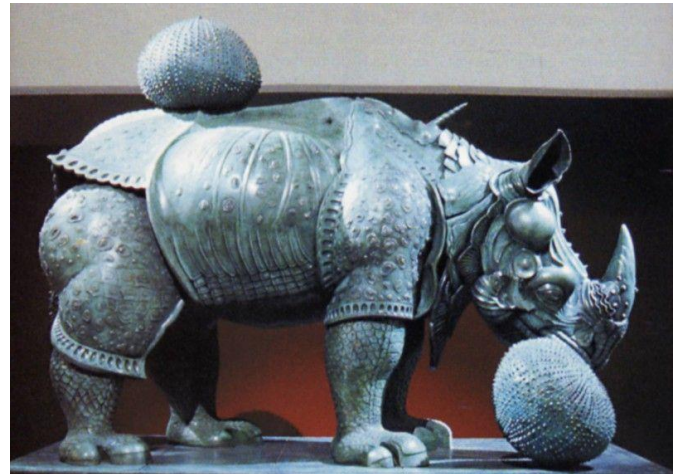
Salvatore Dali, Rhinocéros habillé en dentelles, 1956

Le Rhinocéros de Dürer est le nom généralement donné à une gravure sur bois d'Albrecht Dürer datée de 1515. L'image est fondée sur une description écrite et un bref croquis par un artiste inconnu d'un rhinocéros indien. Dürer n'a jamais vu ce rhinocéros. En dépit de ses inexactitudes, la gravure sur bois de Dürer devint très populaire en Europe et fut copiée à maintes reprises durant les trois siècles suivants.