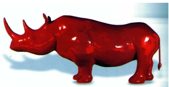
Rhinocéros, Xavier Veilhan, 1999

Dans les années 90, Niki de saint Phalle réalise beaucoup de lithographies très colorées comme ce Rhinocéros auquel elle a ajouté des collages.