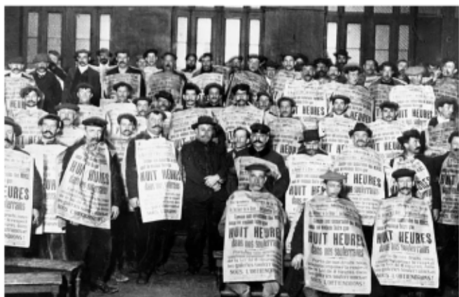
Terrassiers du métro parisien en grève pour la journée de huit heures

« La CGT groupe, en dehors de toute école politique, tous les travailleurs conscients de la lutte