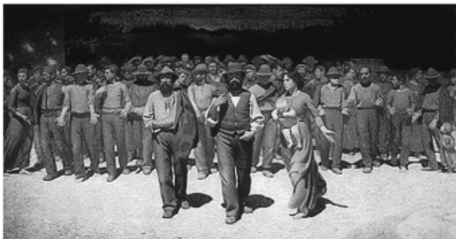
Il Quarto Stato (« Le Quart-État »), peinture de Giuseppe Pellizza, 1901.