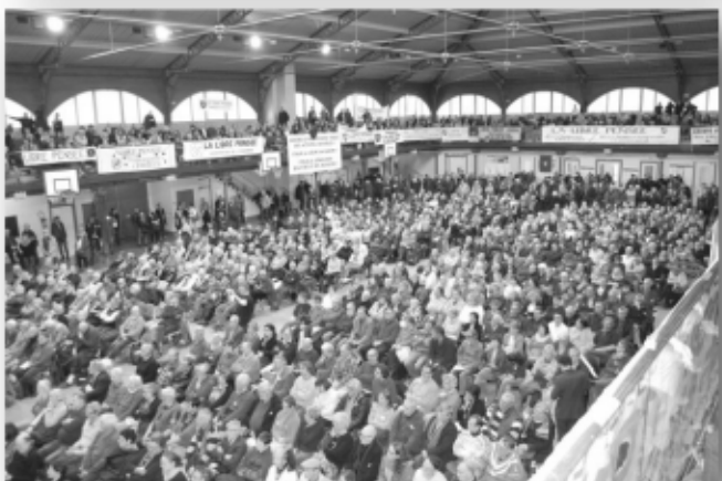
Vues du meeting laïque du 5 décembre 2015, salle Japy