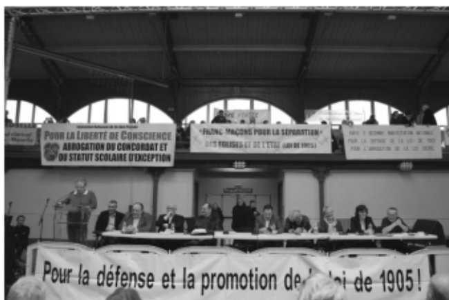
Meeting laïque du 5 décembre 2015, salle Japy à Paris