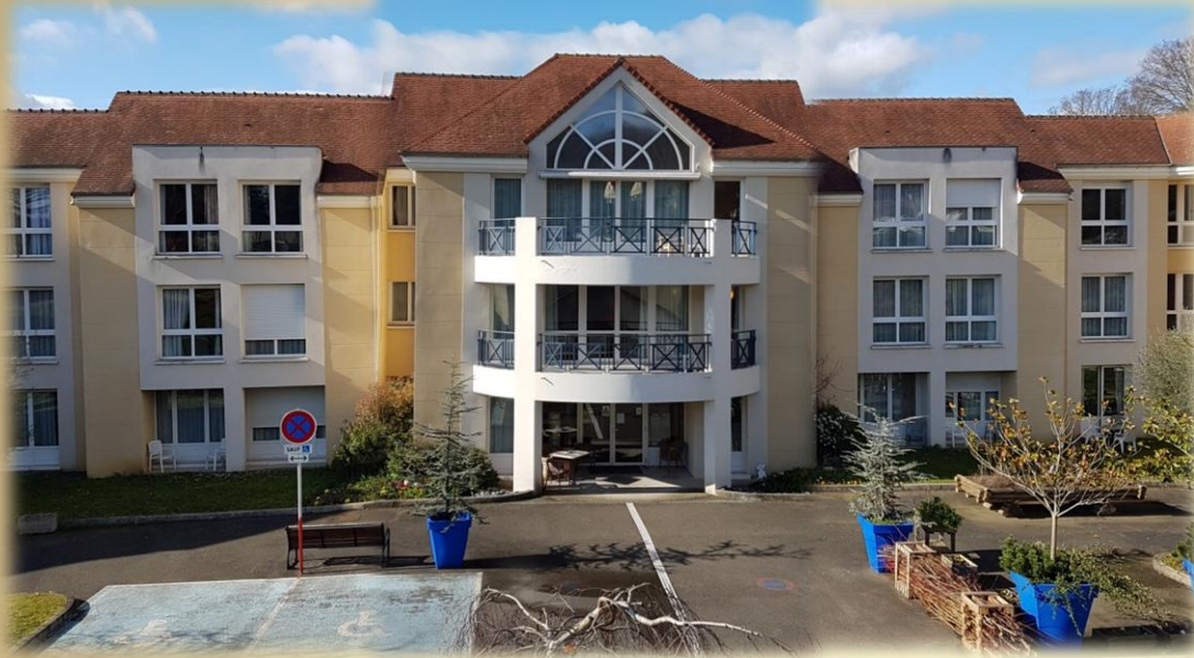
La maison de retraite