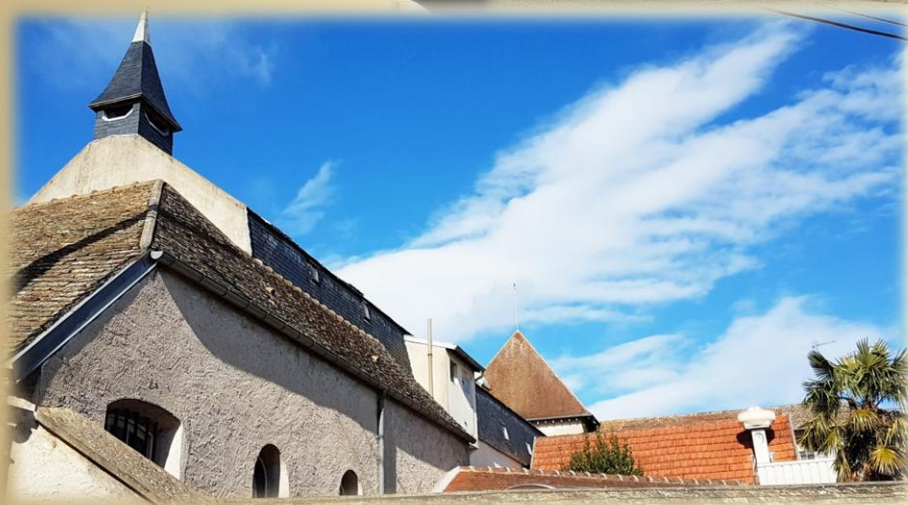
Chapelle et placette de l'hôpital