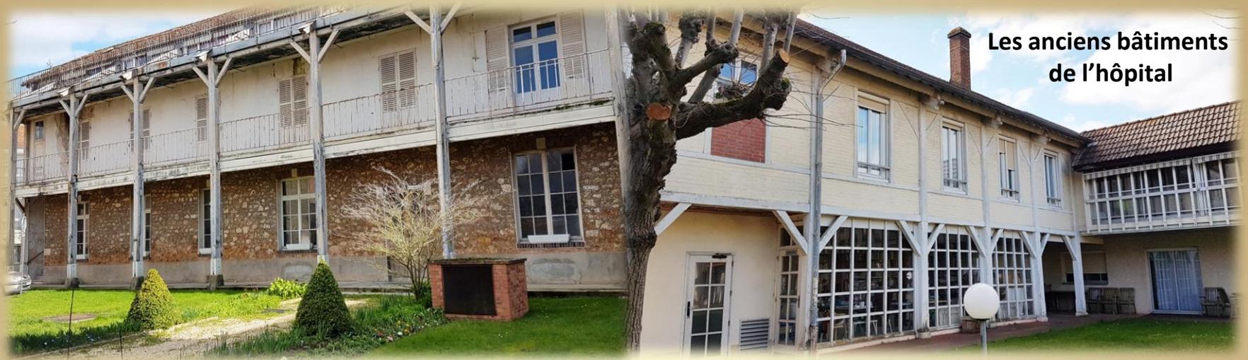
Les anciens bâtiments de l'hôpital