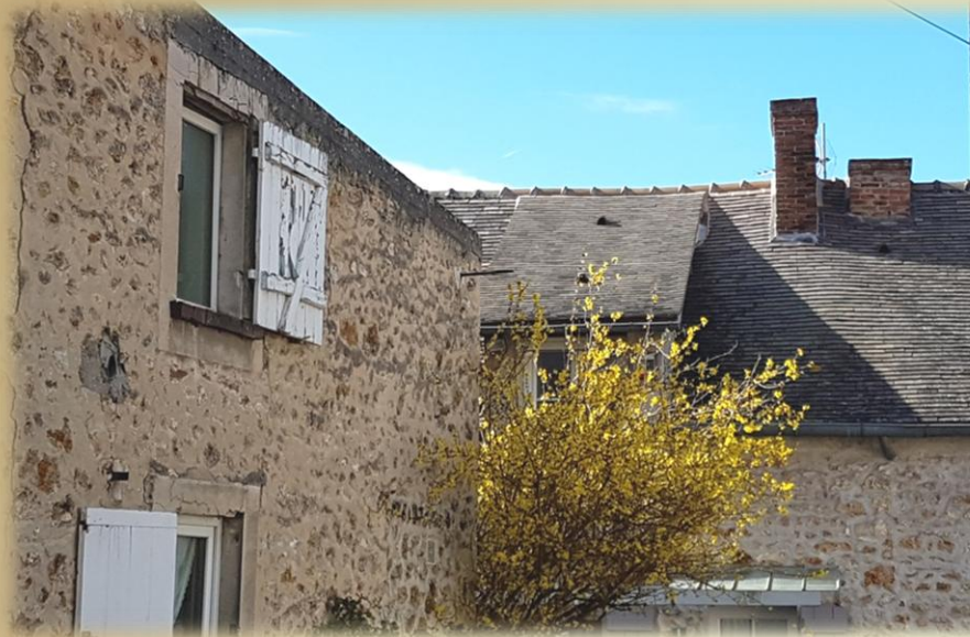
Cour de la Porte d'Andin