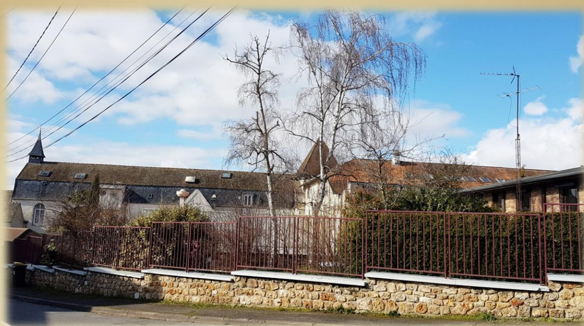
Centre historique de Pontchartrain