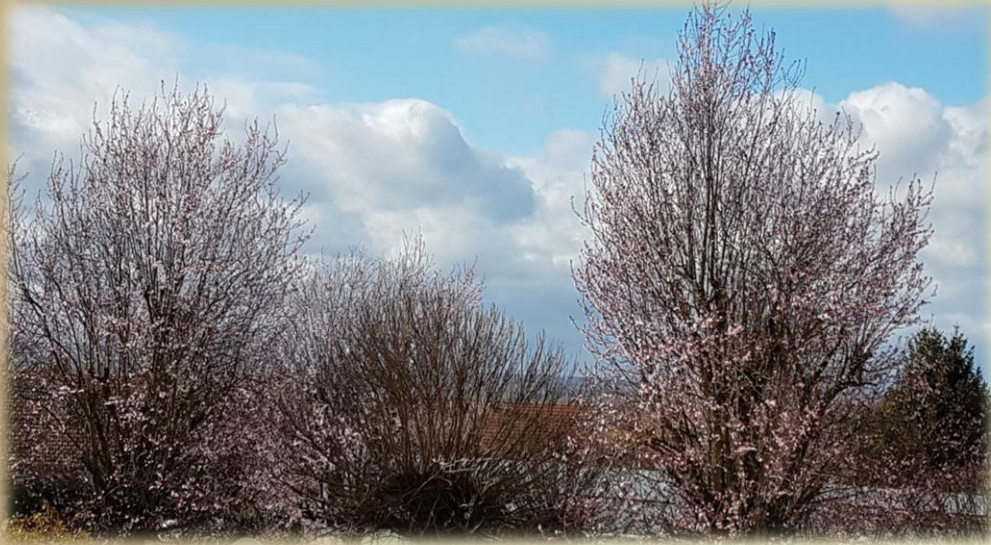
Le parc derrière l'hôpital