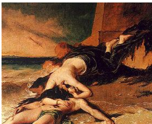
William Etty, Héro et Léandre , 1828