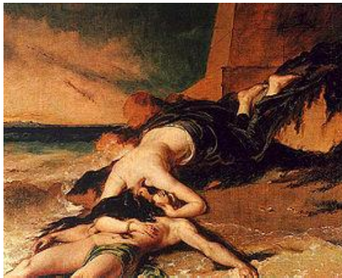
William Etty, Héro et Léandre , 1828