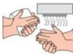
5. Sèche tes mains avec une serviette ou un séchoir automatique