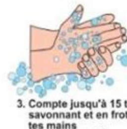
3. Compte jusqu'à 15 tout en savonnant et en frottant tes mains