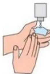
2. Utilise du savon liquide