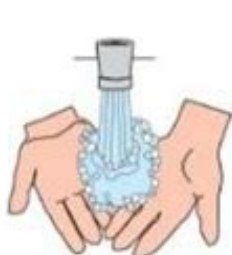
1. Mouille tes mains

Apprendre à se laver les mains en suivant les étapes :