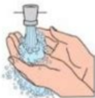
4. Rince tes mains