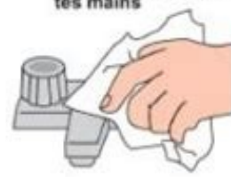
6. Ferme le robinet avec une serviette ou le bout de ta manche

Transvasons : préparer deux contenants (boîtes, bols ...) et une cuillère.